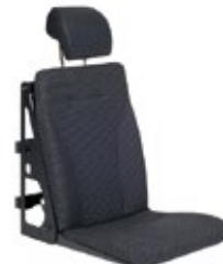
DHT 4 | Standardversion, langes Sitzkissen, ohne 3-Punkt Gurt