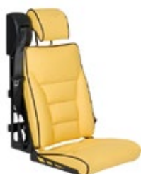
DHT 2 | Luxuspolster, langes Sitzkissen