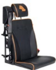
DHT 1 | Lehne vorklappbar, kurzes Sitzkissen