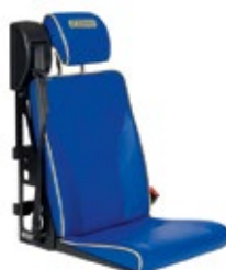
DHT 3 | Standardversion, langes Sitzkissen