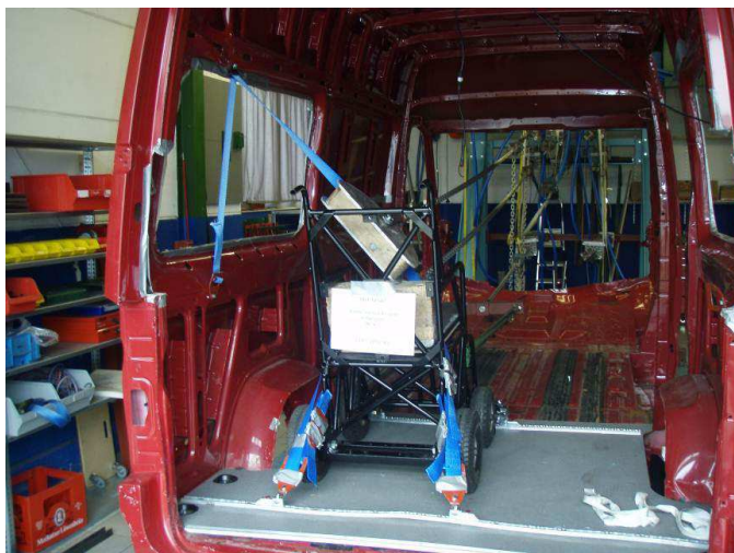
Montage fixe et rail en travers